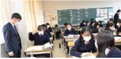
チーム・ティーチングによる授業

数学・英語では、2人の教員が学習内容に応じて習熟度別授業やチーム・ティーチングによる授業を行っており、一人ひとりが各自のペースで学習できます。また、選択教科の一部では高校教員とのチーム・ティーチングを行っています。