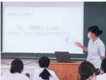
卒業生の話を聞く会

学校行事や部活動などで、高校生と共に活動したり、先輩方の話を聞いたりする機会があります。また、体験的な学習を重視した道徳の授業や学級活動も実施しています。