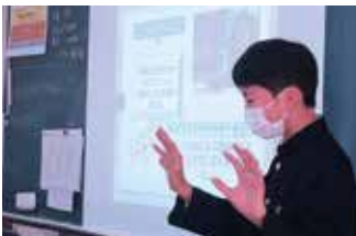
コミュニケーションの授業（ブクトーク）

各教科の様々な課題を解決する中で自分の考えや思い、感じたことを相手に伝え（話す力）、相手から引き出し（聞く力）、表現する力を育成します。