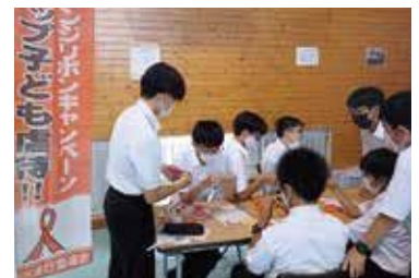
オレンジリボンキャンペーン