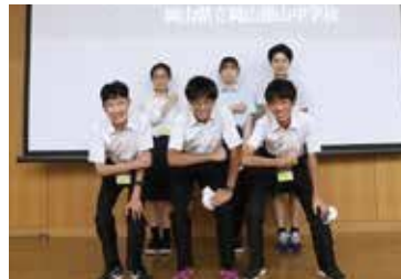
ディベート甲子園

グローバルリーダーを育成するプロジェクトの一環として、「SOZAN 国際塾」の活動があります。 意欲ある生徒を対象に、将来国際機関やグローバルビジネス界などで活躍する人材を育成することが目的です。 社会貢献（ボランティア）、コミュニケーション、課題研究などの3つのプロジェクトが展開されています。