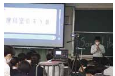
SOZAN Liberal Arts（自主研究発表会）