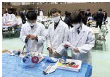
サイエンスチャレンジ