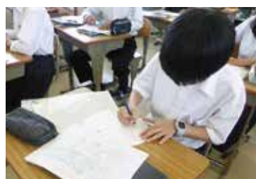
うちわ作り（福祉施設への寄贈）