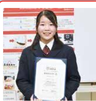
サイエンスキャッスル中四国大会 ポスター部門 最優秀賞