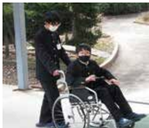
福祉体験 車いす体験