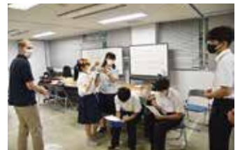
国際理解（イングリッシュキャンプ）