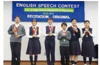
英語スピーチコンテスト