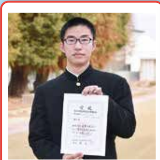
第49回 全日本中学校陸上競技選手権大会 (全中) 出場 (福島県) 第52回 U16 陸上競技大会出場 (愛媛県) 第59回 岡山市総体 100m第1位 (大会新記録)