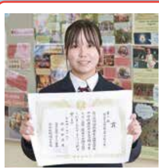
高宮杯全日本英語弁論大会 岡山県大会 創作の部 第2位