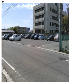
プラザホテル従業員駐車場

駐停車は、近隣の方々への迷惑になるだけでなく、自転車の進路をふさぐことになり交通事故を誘発する危険がありますので、駐停車しないようにご協力をお願いいたします。