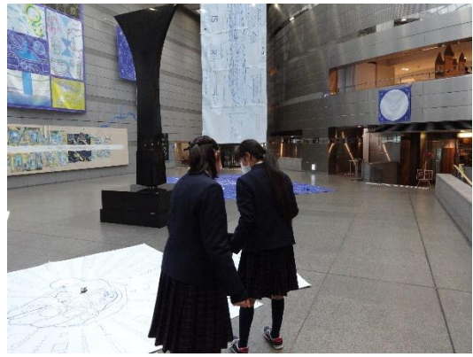
高松市美術館 見学